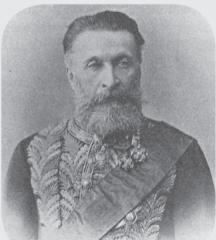
Министр юстиции (1885-1894) Н.А. Манасейн

Проект, ею созданный, с незначительными изменениями внесен в Государственный Совет министром юстиции Н.А. Манасеиным.