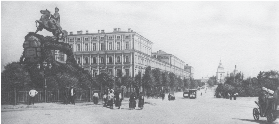
Киев. Присутственные места