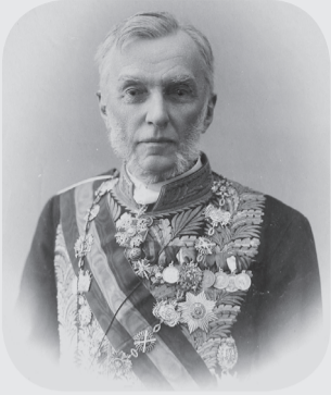
Министр юстиции (1867-1878) граф К.И. Пален

Проект изменений в адвокатуре (и, по сути, «уничтожения ее независимости». — Прим. ред.)