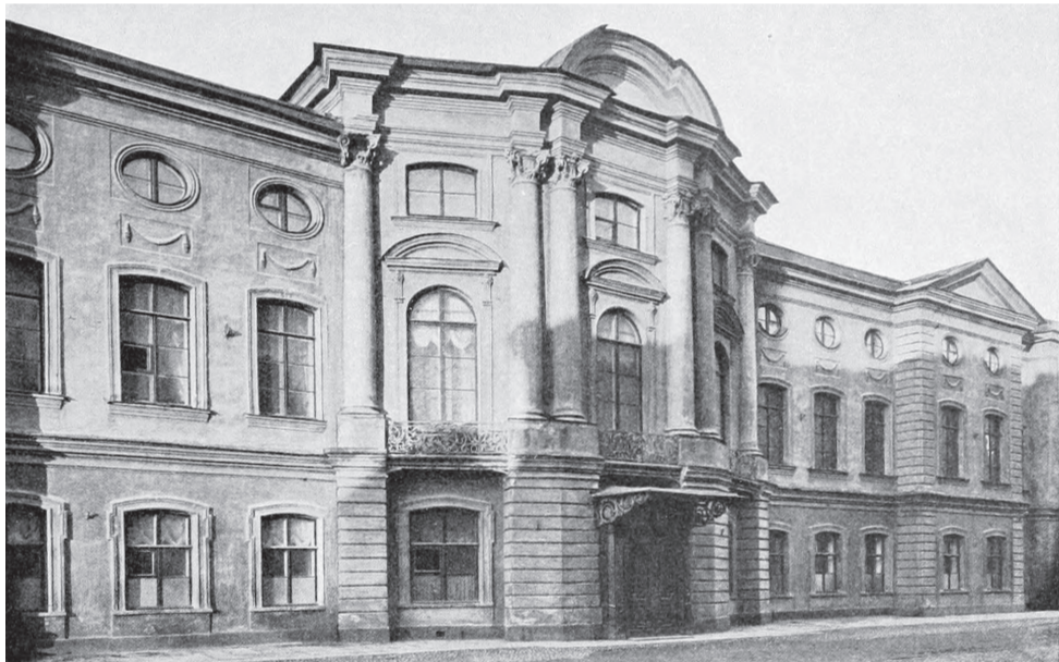
Дом И.И. Шувалова, ныне Министерства юстиции на Итальянской в СПб. 1753–1754 гг.

В Как известно, положение о монопольном праве присяжной адвокатуры закреплено в Судебных Уставах 1864 г. Статья 387 Учр. Суд. Уст. гласит: «В тех городах, где имеет жительство достаточное число присяжных поверенных, тяжущиеся могут давать доверенности на хождение по тяжбы делам, принадлежащим к числу сих поверенных». Следующая за ней ст. 388 установила: «Число присяжных поверенных, признаваемое достаточным (ст. 387) в городах уездных и губернских и в столицах, определяется в особой таблице, которую министр юстиции, по представлениям Судебных палат, вносит через Государственный Совет на Высочайшее утверждение».