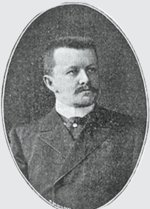
Министр юстиции (1894-1905) Н.В. Муравьев

Передан в особую Комиссию по пересмотру законоположений по судебной части.