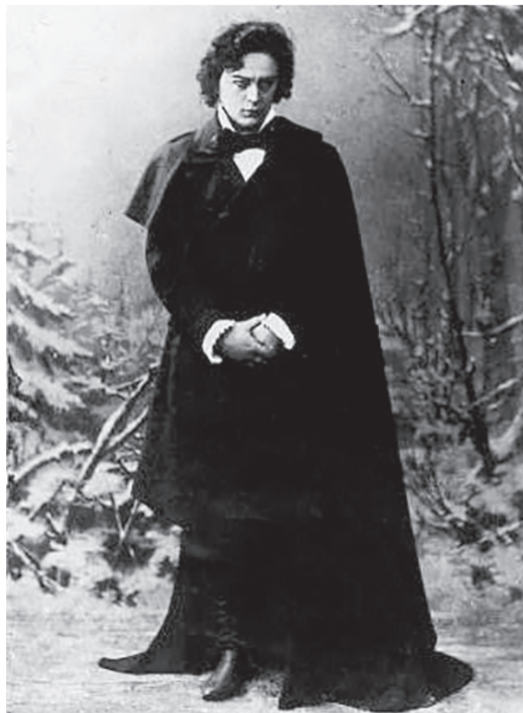
В роли Ленского (опера П.И. Чайковского «Евгений Онегин»)

Однако, как и в случае с г-ном Леонидом Андреевым, остановившем выбор свой на литературе, уверены: если мы и потеряли г-на Собинова как коллеги, то, несомненно, приобрели его как слушатели!