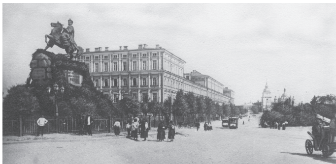
Киев. Присутственные места