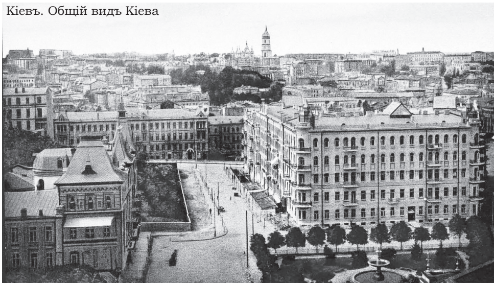
Кіевъ. Общій видъ Кіева